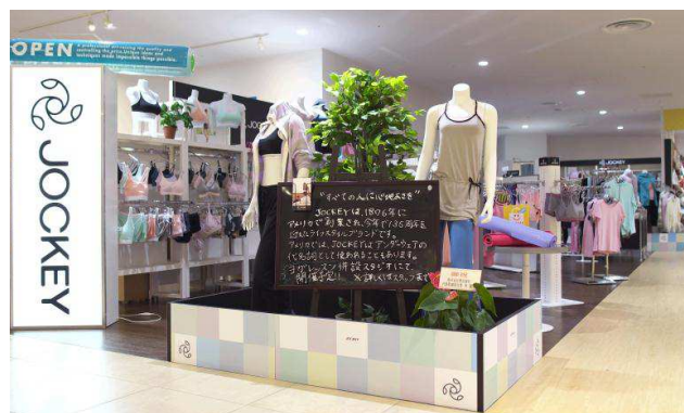
JOCKEY コレットマーレ店（横浜）